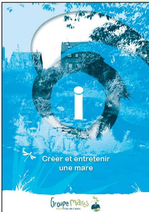
Créer et entretenir une mare