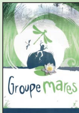
Présentation du Groupe Mares