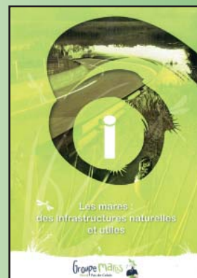
Les mares des infrastructures naturelles et utiles